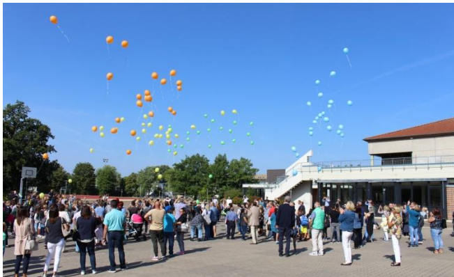
Die neuen Schülerinnen und Schüler der Klassen 5 lassen gemeinsam bunte Luftballons in den Himmel steigen.

ich wünsche Ihnen und euch viel Erfolg für das vor uns liegende Schuljahr 2018/2019. Herzlich willkommen heißen möchte ich an dieser Stelle nochmals die Eltern und Erziehungsberechtigten unserer neuen Klassen 5.