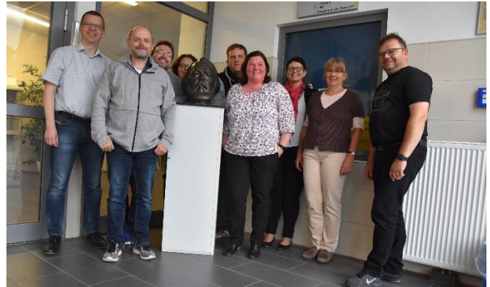
Die Gründungsmitglieder des neuen Fördervereins

Sobald alle Formalitäten erledigt sind, erhalten Sie alle eine Beitrittserklärung. Ich würde mich freuen, wenn möglichst viele Eltern dem neuen Förderverein beitreten und somit unsere schulische Arbeit unterstützen würden.